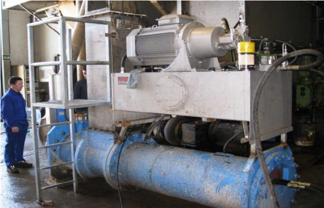
In Spanien aufgestellte Rohmaterialpumpe