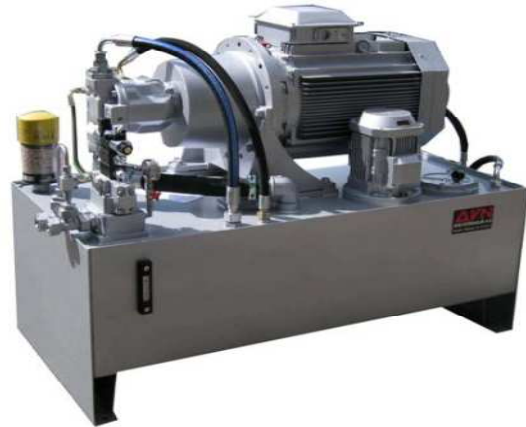
Hydraulikaggregat für die Rohmaterialpumpe

Fragen Sie uns bitte nach anderen Kapazitäten